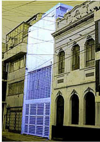
Sede de "Espacio Vacío" Barrio Chapinero, Bogotá.

Cuando Espacio Vacío abrió sus puertas al público a comienzos de 1997, lo hizo sin manifiestos excluyentes, apologías a estilos o tendencias, ni ideas preconcebidas acerca de lo que "debía" acontecer en el Espacio.